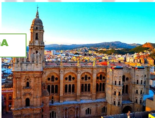
CATEDRAL DE MALAGA