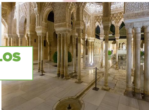
FORTALEZA DE LOS SOBERANOS