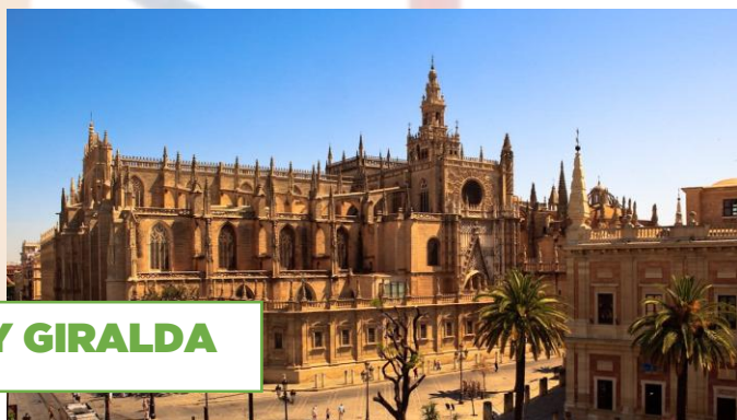
CATEDRAL Y GIRALDA