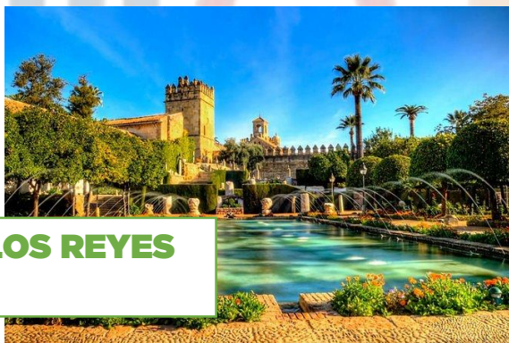
ALCAZAR DE LOS REYES CRISTIANOS