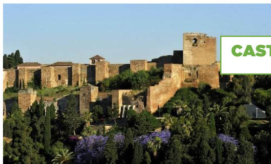
CASTELLO DE GIBRALFARO